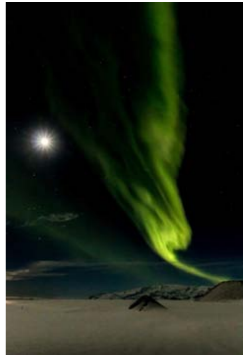
Aurore boréale

Communiquez entre clubs régionaux avec « LA LETTRE »