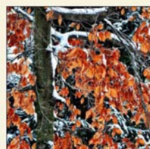
La Forêt m'a dit .....