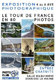
Photo-club d'Epinais sur Orge – Exposition « Le tour de France en 80 photos »

Exposition du 4 avril au 6 avril, salle de la Gilquinière, derrière la mairie d'Epinais sur Orge. Vous êtes attendus le samedi de 9h à 18h, les dimanche et lundi de 10h à 18h. Le finissage aura lieu lundi à partir de 17h. « Nous vous attendons nombreux pour découvrir les beaux paysages de France vus par les 35 adhérents du Photo-club d'Epinais sur Orge » Marie-Laure Wetzler.